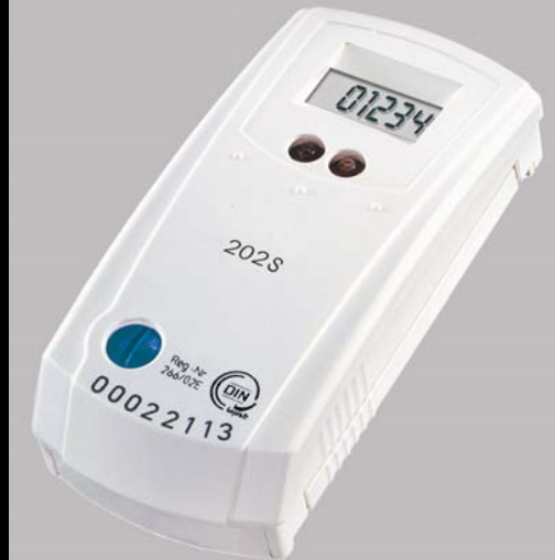
Elektronischer Heizkostenverteiler HKV-E 202 S mit Stichtagprogrammierung