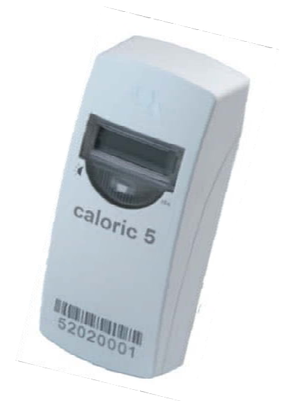
Elektronischer Heizkostenverteiler Caloric 5

Erich Hundt GmbH Heizkostenverteiler - Heizkostenabrechnung 2340 Mödling, Gabrieler Straße 25 T 02236 42320 F 02236 892110 office@hundt.at www.hundt.at